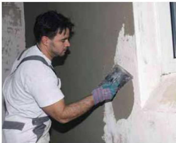
PCI® Pericret имеет пластичную консистенцию, удобен в применении

Тиксотропная сухая смесь для выравнивания вертикальных, горизонтальных и потолочных поверхностей