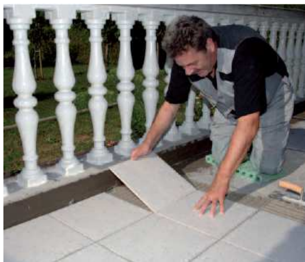
С помощью PCI Rapidflott можно быстро и надежно укладывать керамическую плитку на балконах и террасах.